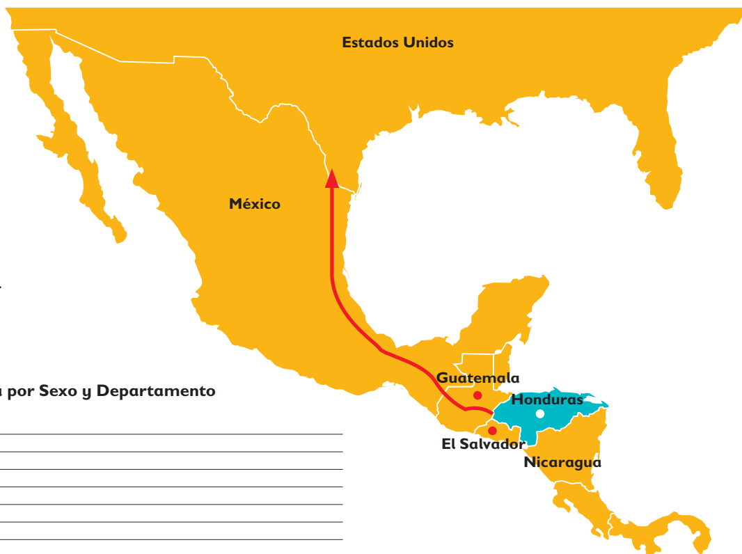
Niñez Retornada por Sexo y Departamento